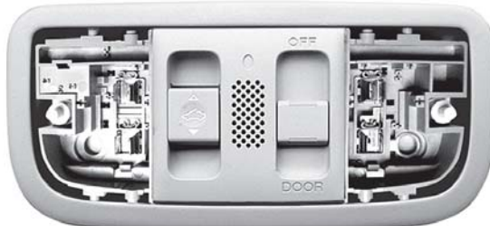
Bタイプ 反射板なし