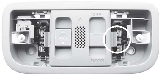
Aタイプ 樹脂製の反射板あり

本製品が取り付け可能なルームランプは下記図のAタイプ、Bタイプの2種類あり、AタイプとBタイプでは取付け方法が異なります。お取り付けのお車のランプタイプをご確認の上、下記手順にしたがって取り付けを行なって下さい。