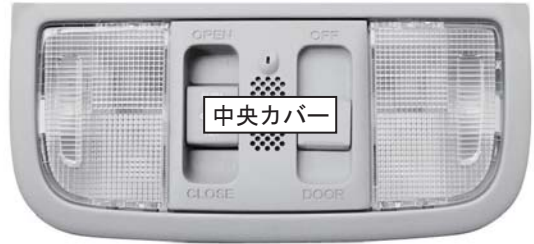
Bタイプ 中央カバー付