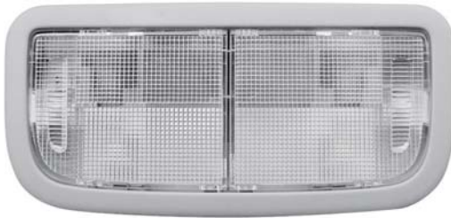
Aタイプ 全面レンズ

本製品が取り付け可能なルームランプは下記図のAタイプ、Bタイプの2種類あり、AタイプとBタイプでは取付け方法が異なります。お取り付けのお車のランプタイプをご確認の上、下記手順にしたがって取り付けを行なって下さい。