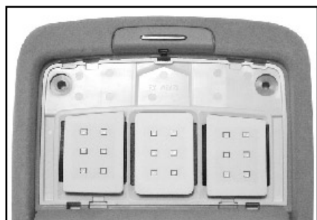
図1を参考にして、レンズを図2のレンズCとレンズDわけます。※レンズDは使用しません。大切に保管してください。

純正球を取外します。※純正球は非常に熱くなっているため、必ず軍手をして作業をしてください。※電球が割れやすいので慎重に作業を行なってください。